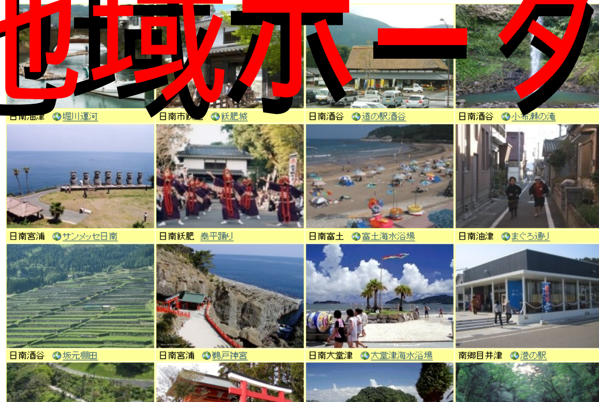
日南油津 堀川運河 日南市 鉄肥城 日南酒谷 道の駅酒谷 日南酒谷 小布瀬の滝 日南宮浦 サンメッセ日南 日南鉄肥 秦平踊り 日南富士 富士海水浴場 日南油津 まぐる通り 日南酒谷 坂元棚田 日南宮浦 鶴戸神宮 日南大堂津 大堂津海水浴場 南郷目井津 港の駅